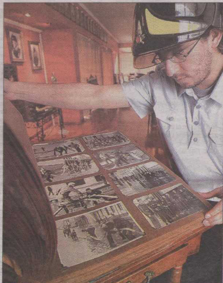
IMÁGENES ÚNICAS.- Album fotográfico que da cuenta de la historia de la bomba y de Valparaíso, a través de imágenes únicas.