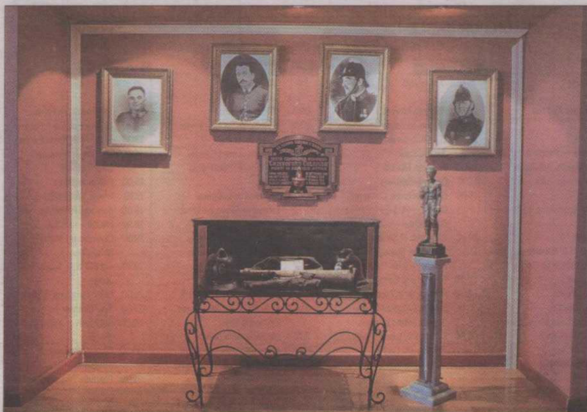
SANTUARIO.- Vitrina de los mártires caídos en servicio, durante una explosión que en 1953 privó a Valparaíso de 36 bomberos de distintas compañías.

En fin, es mucho y muy rico el acervo documental que nos ofrece esta compañía, abierta a proyectos y a quienes deseen cooperar con la restauración de una parte de nuestra historia.