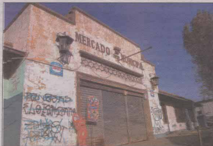
MERCADO MUNICIPAL.— Que alguna vez fuera el eje comercial del Barón, hoy espera paciente su restauración.