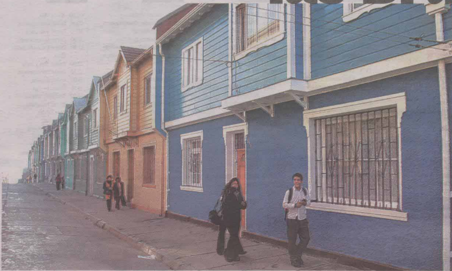
POBLACIÓN FERROVIARIA.— En calle Castro se inunda de color el diario vivir de los baroninos.

Para mayor información sobre "Caminarte", contactarse al sitio: lakahuala@yahoo.com .