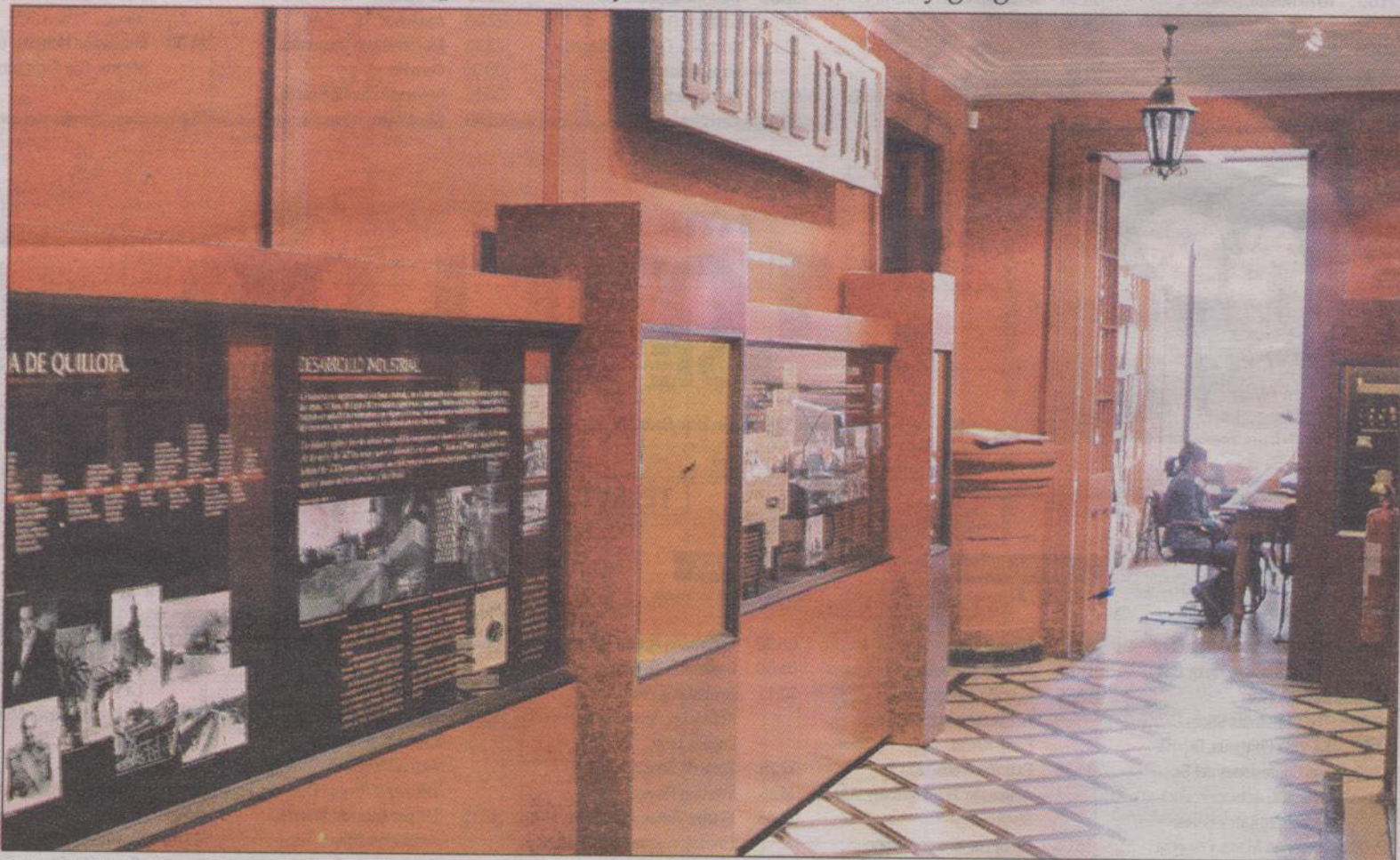
HALL DE ACCESO.— El museo acoge a estudiantes, investigadores y público en general, que desee conocer más sobre la historia de la ciudad y del valle.

Sin embargo, todo podría ser mejor para este museo que se esfuerza por preservar y difundir el patrimonio quillotano, si contara con el apoyo de la comunidad para rescatar la antigua estación ferroviaria de la ciudad que está a punto de sucumbir ante la garra