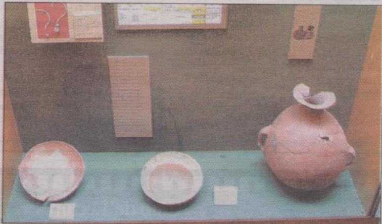
CULTURA ACONCAGUA.— Objetos pertenecientes a la Cultura Aconcagua encontrados durante la construcción del Estadio Municipal.

inmobiliaria; y obtener la administración del terreno donde se ubica la casa patrimonial que lo alberga con la finalidad de ampliar su oferta cultural.